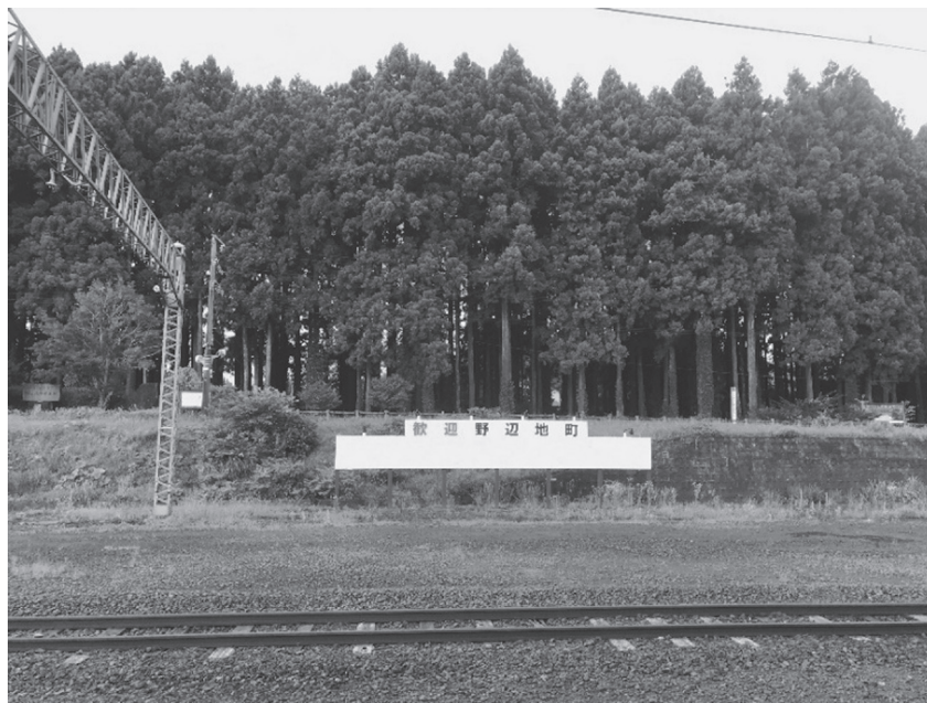
(野辺地駅のホームから陸奥湾方面を見たようす)

問6 下線部⑥について、これらの木々はある目的のために線路沿いに植えられました。特に、野辺地駅をはじめとした駅のそばには、次の写真のように、海岸と駅のホームとの間に密集して植えられていました。これらの木々が植えられた目的を、青森県の冬の気候の特徴にも触れながら、 20字以内 で答えなさい。